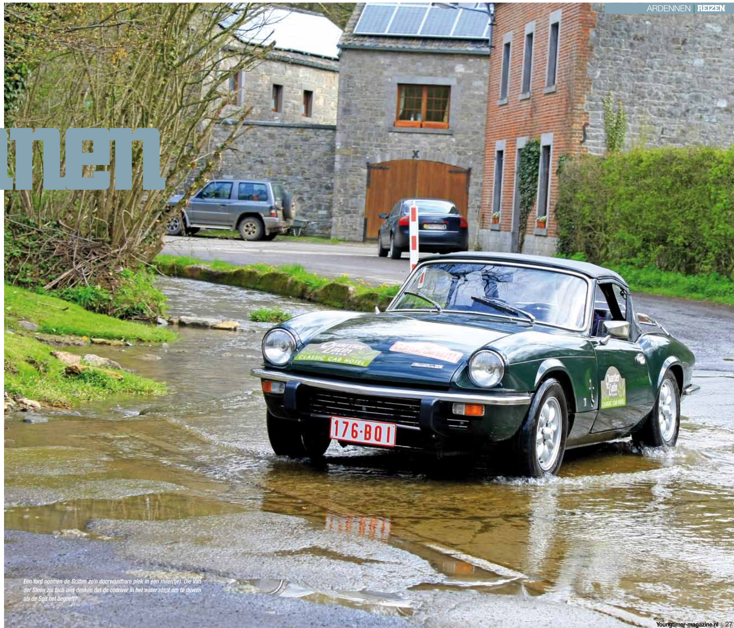
Een ford noemen de Britten zo'n doorwaadbare plek in een rivier(tje). Die Van der Steen zal toch niet denken dat de codriver in het water stapt om te duwen als de Spit het begeeft?

HOTELIER POUCKET heeft een fraai gasthuis in Marche-en-Famenne, hartje Ardennen, en heeft enkele klassiekers paraat in zijn parkeergarage, waarmee hotelgasten een automobiele promenade door de smakelijke omgeving kunnen maken. Een omgeving, waar je nog kettinghonden ontwaart en waar het lijkt, of alle koeien nog gewoon buiten lopen. Bij ons thuis in Brabant zie je dat ook nog, maar daar subsidieert Campina de boeren tegenwoordig voor. Dat schijnt de melkverkoop te stimuleren. In de Ardennen gaat het er heel wat ouderwets (lees: authentieker) aan toe. Rond Marche-en-Famenne, al bijna Luxemburg, ziet het zwart van de runderen; zwart, wit, bruin, dikbil en Limousin, Schots gehoord en Belgisch bont. Prachtig. Het lijkt of iedereen hier boert of leeft van de bosbouw. Want met regelmaat hoor je een kettingzaag of zie je een met houtblokken