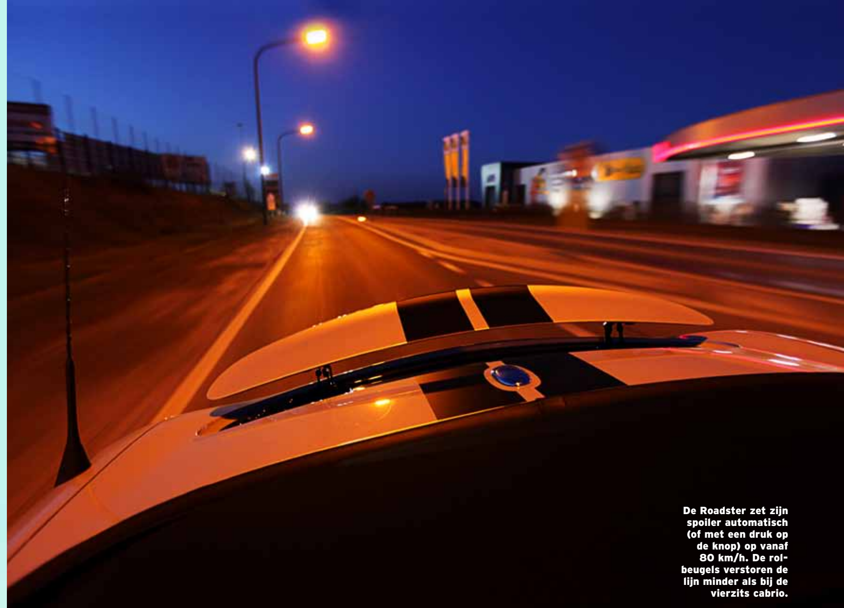
De Roadster zet zijn spoiler automatisch (of met een druk op de knop) op vanaf 80 km/h. De rolbeugels verstoren de lijn minder als bij de vierzits cabrio.